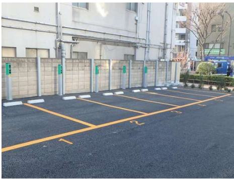
フラップレス式駐車場